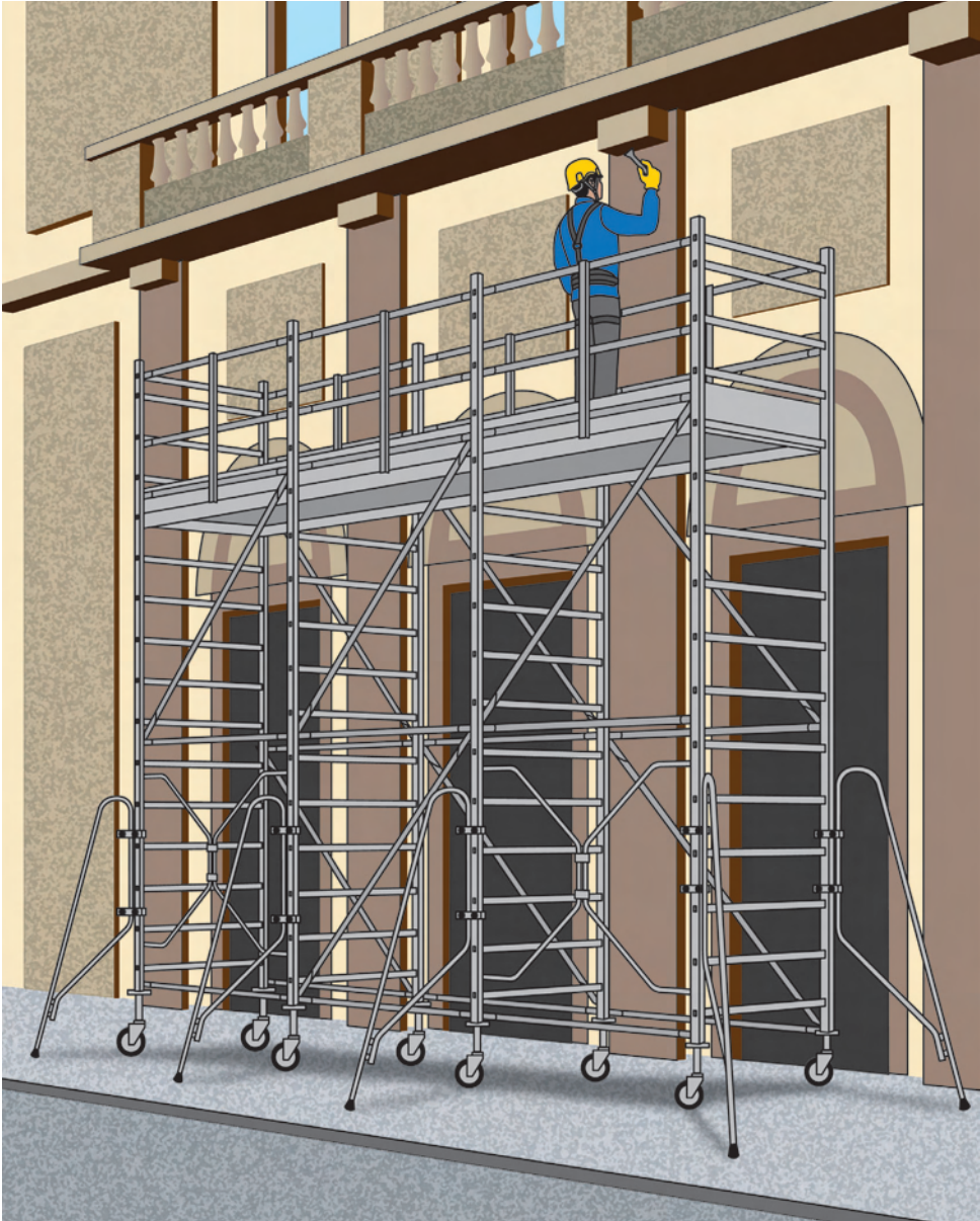
Figura 5 - Utilizzo di un trabattello multiplo (se previsto dal fabbricante)