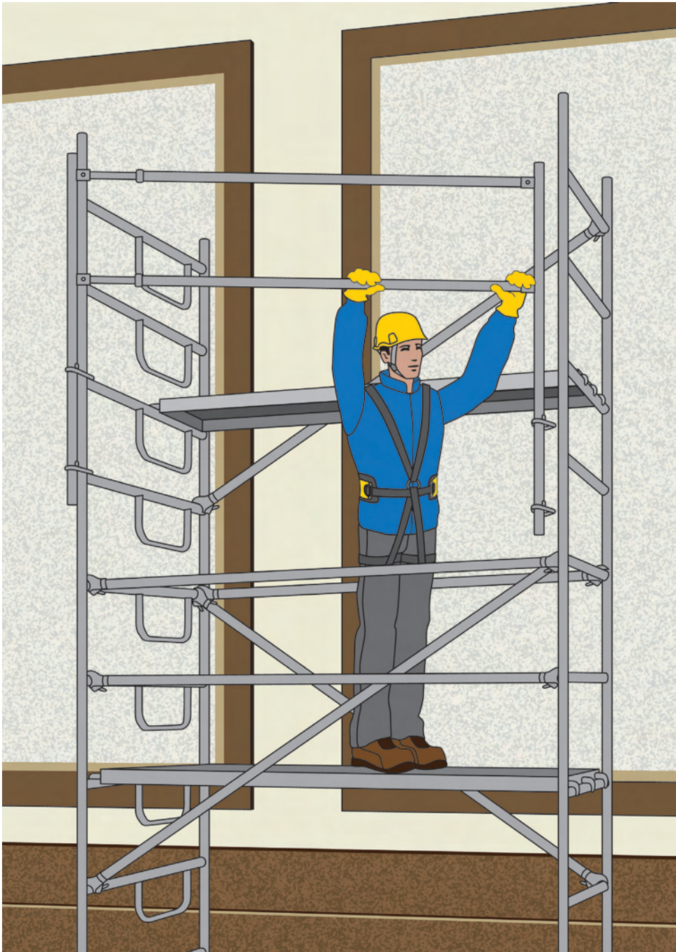
Figura 4 - Trabattello con montaggio dal basso